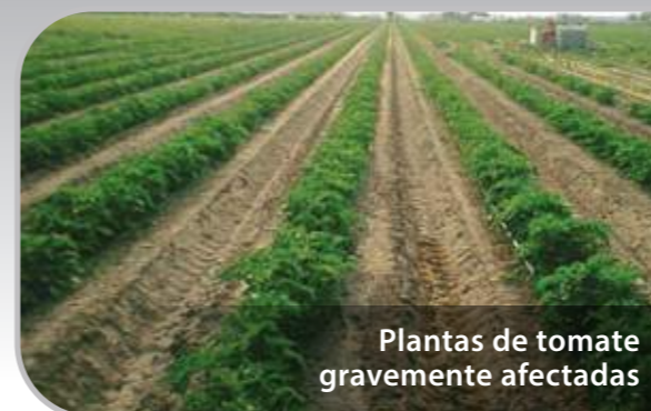
Plantas de tomate gravemente afectadas