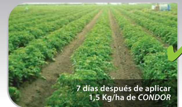
7 días después de aplicar 1,5 Kg/ha de CONDOR